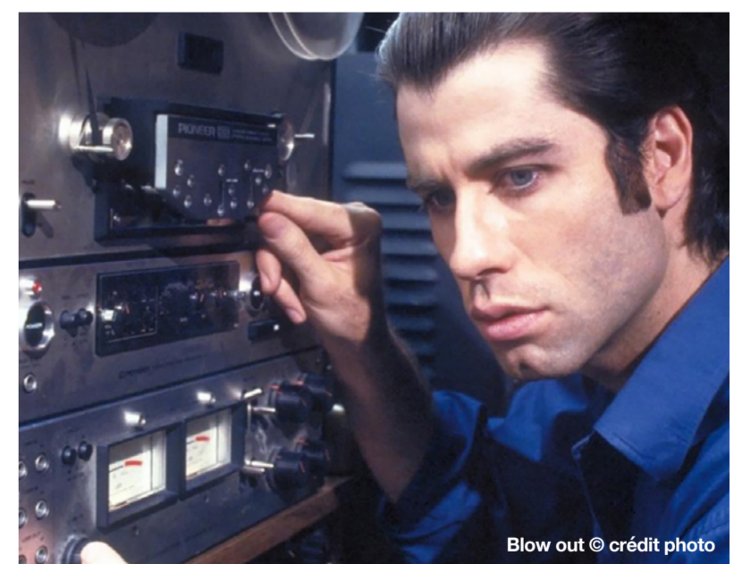
Blow out

« On y parle également de conspiration post affaire du Watergate ; c'est un film à l'intrigue puissante et originale, qui aborde le thème de la quête de vérité, et dont il ne faut surtout pas manquer la fin. »