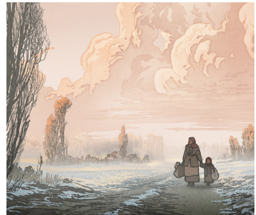
La plus précieuse des marchandises

Un dispositif national d'éducation à l'image coordonné par le RECIT (Alsace), Cinéligue-CRAVLOR (Lorraine) et TCB : Télé Centre Bernon (Champagne-Ardenne), soutenu par la Région Grand Est, le Ministère de la Culture et de la communication (Direction Régionale des Affaires Culturelles Grand Est, CNC) en partenariat avec les Académies de Nancy-Metz, Reims, Strasbourg et les salles de cinéma participantes.